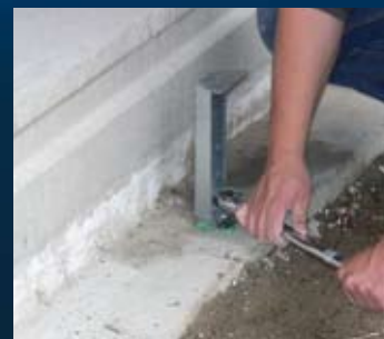
aandraaien m.b.v. momentsleutel