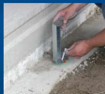
plaatsen Drukplaten met sleuf