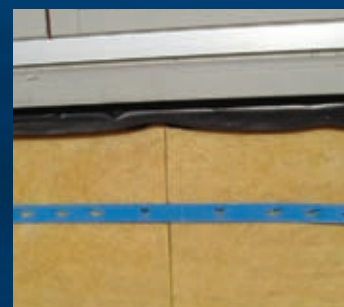
Minerale wol op de langsgevel met Iso-jane