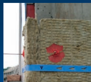
Minerale wol met Iso-jane