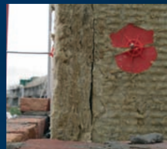
Minerale wol zonder Iso-jane