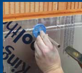
aanbrengen UNI-Perfoplug en inslaan m.b.v. Inslaghulp