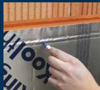
plaatsen isolatie en bepalen plaats UNI-Perfoplug