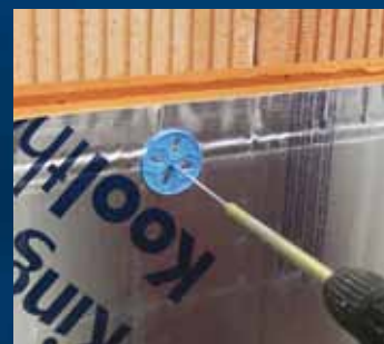
indraaien UNI-Bouwsouwanker m.b.v. Indraaihulpstuk