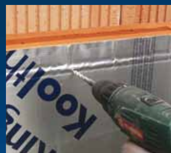
gat boren Ø8 mm