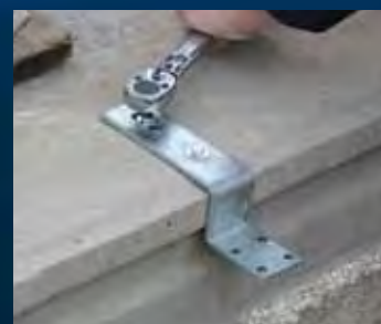
aandraaien bevestigingsmiddelen (volgens richtlijnen leverancier)