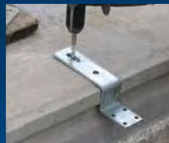
plaatsen Vloer-kozijnstrip en boren gaten