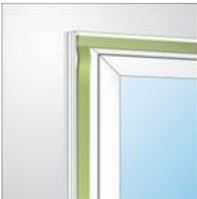
Hoek aansluiting bij de kozijnmontage