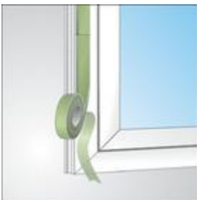
Stuik aansluiting bij kozijnmontage