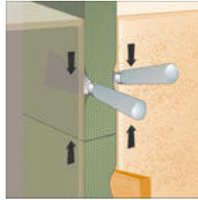
Stuik aansluiting verticale voegen