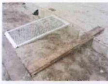
Afbbeelding 1. Praktijksituatie Rooster veiliger dan plank