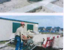
Afbbeelding 6, 7 en 8. Praktijksituatie Maxi-rooster op container