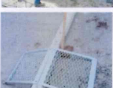
Afbbeelding 4. Praktijksituatie overbrugging met 2 roosters