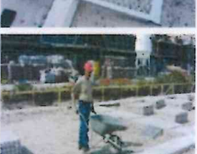
Afbbeelding 5. Praktijksituatie Midi-rooster op fundering