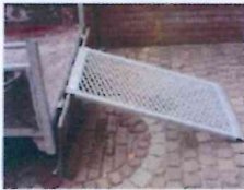
Afbbeelding 2. Praktijksituatie Midi-rooster aan aanhangwagen