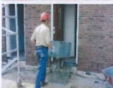
Afbbeelding 3. Praktijksituatie Midi-rooster op dorpel